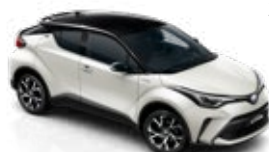
2NA Pearl White/Astral Black lakier perłowy bez dopłaty – Selection Pure