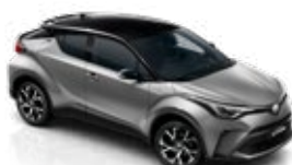
2NK Metal Stream/Astral Black lakier specjalny bez dopłaty – Selection Platinum