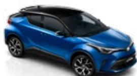
2NH Nebula Blue/Astral Black lakier metalizowany bez dopłaty – Selection Sapphire