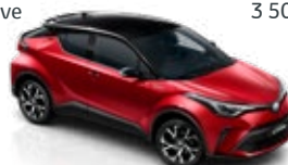
2TB Imperial Red/Astral Black lakier specjalny bez dopłaty – Selection Passion