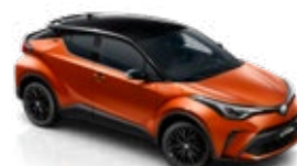
2TC Hot Orange/Astral Black lakier specjalny bez dopłaty – PREMIERE EDITION

Kolor nadwozia może być zależny od wersji wyposażenia.