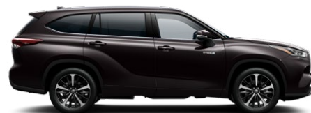
4X9 Blackish Brown lakier metalizowany bez dopłaty