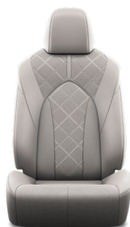
Tapicerka skórzana z perforacją (skóra naturalna i syntetyczna) w kolorze szarym Standard w wersji Executive