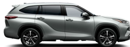
1J9 Silver Metallic lakier metalizowany bez dopłaty