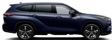
8X8 Elite Blue lakier metalizowany bez dopłaty