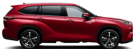
3T3 Tokyo Red lakier specjalny 1 500 PLN