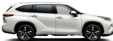
070 Pearl White lakier perłowy 1 500 PLN