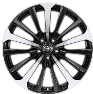
20" felgi aluminiowe z oponami 235/55 R20 Standard w wersji Executive