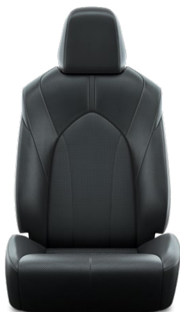
Tapicerka skórzana z perforacją (skóra naturalna i syntetyczna) w kolorze czarnym Standard w wersji Prestige