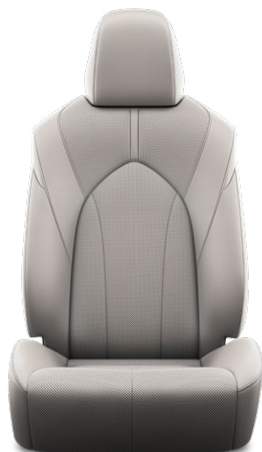
Tapicerka skórzana z perforacją (skóra naturalna i syntetyczna) w kolorze szarym Standard w wersji Prestige