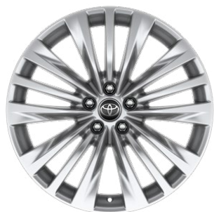
20" felgi aluminiowe z oponami 235/55 R20 Standard w wersji Prestige