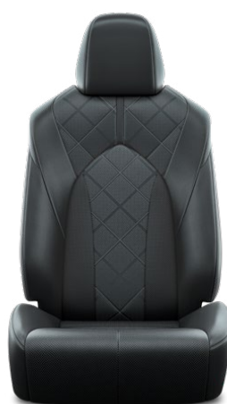
Tapicerka skórzana z perforacją (skóra naturalna i syntetyczna) w kolorze czarnym Standard w wersji Executive