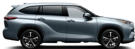
1K5 Moon Dust lakier specjalny 1 500 PLN