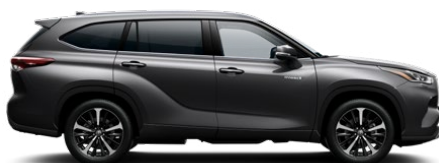
1G3 Royal Grey lakier metalizowany bez dopłaty