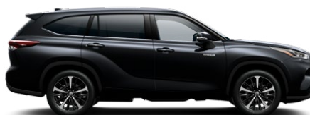
218 Attitude Black lakier metalizowany bez dopłaty

Kolor nadwozia może być zależny od wersji wyposażenia.