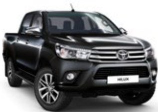
218 Attitude Black lakier metalizowany 3 900 PLN