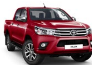
3T6 Crimson Spark Red lakier metalizowany 3 900 PLN