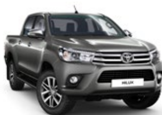
1G3 Royal Grey lakier metalizowany 3 900 PLN