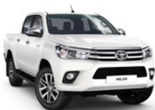
040 Pure White lakier podstawowy bez dopłaty