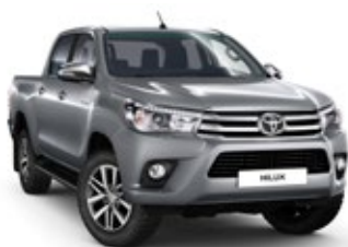
1D6 Misty Silver lakier metalizowany 3 900 PLN