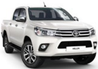
070 Pearl White lakier perłowy 4 500 PLN