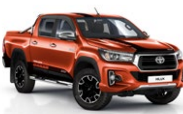
4R8 Hot Orange Lava lakier metalizowany bez dopłaty – Dakar

Kolor nadwozia może być zależny od wersji wyposażenia.