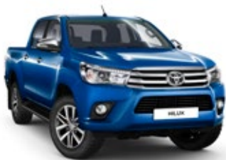
8X2 Nebula Blue lakier metalizowany 3 900 PLN