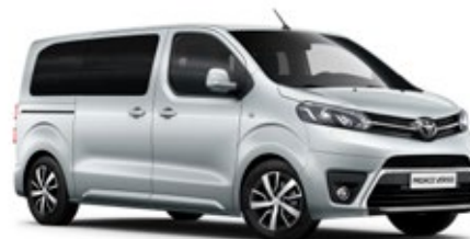
EZR Żywe srebro*