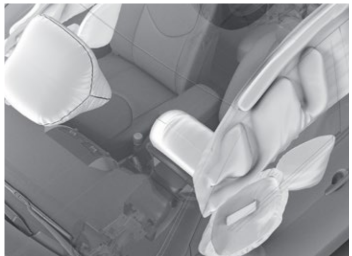
Poduszki powietrzne kierowcy i pasażera, boczne poduszki kurtynowe chroniące głowę oraz klatkę piersiową w 1. rzędzie siedzeń, poduszki kurtynowe boczne w 2. i 3. rzędzie.