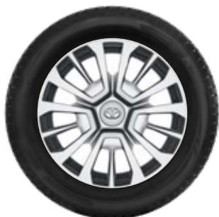
Felgi stalowe 16"/17" z kołpakami Standard w wersjach Business (16") i Family (17")