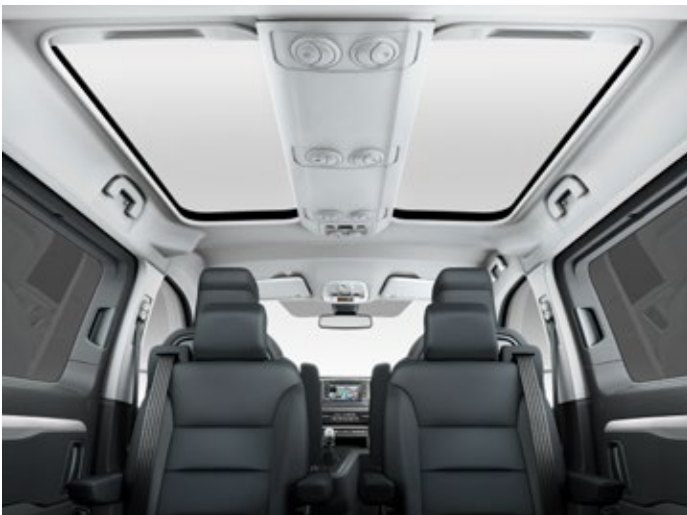
Dach multifunkcyjny (w wersji VIP z dodatkowym podświetleniem AMBIENT LED ring) daje dużo światła wszystkim pasażerom zarówno w dzień, jak i w nocy.