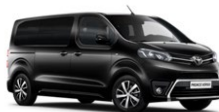
EXY Sycylijska czerń