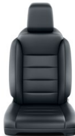
Tapicerka skórzana w kolorze czarnym Standard w wersji VIP, opcja w wersji Family (Pakiet Executive)