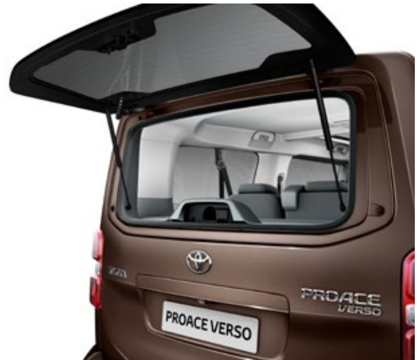
Otwierana szyba w tylnej klapie umożliwia dostęp do środka pojazdu bez konieczności uchylania całej klapy.