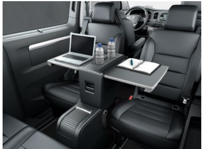
Wielofunkcyjny stolik pomiędzy 2. i 3. rzędem, dostępny w wersji VIP, znacząco poprawia komfort pasażerom podróżującym z tyłu.