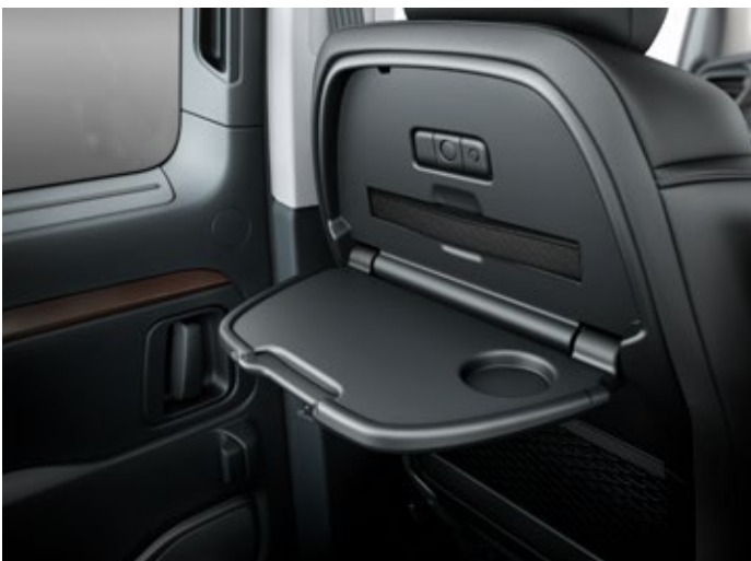
Stoliki w oparciach przednich foteli umożliwiają pasażerom trzymanie pod ręką drobnych przedmiotów.