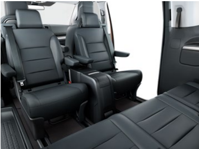
W wersji VIP w 2. rzędzie znajdują się dwa wyjątkowo komfortowe fotele kapitańskie z możliwością obracania tyłem do kierunku jazdy (montowane na szynach).