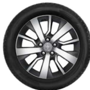
Felgi aluminiowe 17" Standard w wersji VIP, opcja w wersjach Business (Toyota Traction Select Plus) i Family (Style/Toyota Traction Select Plus)