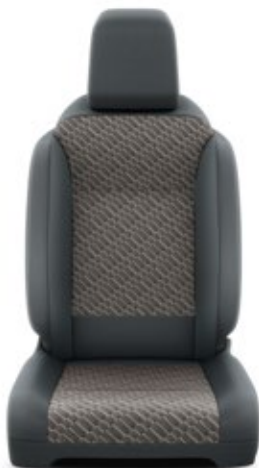
Tapicerka materiałowa Toyota unique w kolorze czarnym z elementami brązowymi Standard w wersji Family