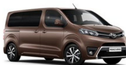
KCM Głęboki brąz*