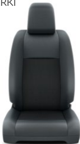
Tapicerka materiałowa w kolorze ciemnoszarym Standard w wersji Business