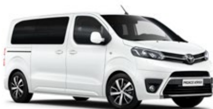
EWP Arktyczna biel