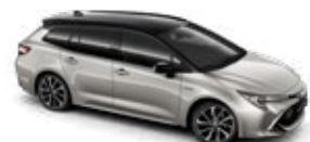
2RD Precious Silver/Eclipse Black lakier specjalny bez dopłaty – Selection Platinum