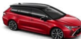
2SZ Imperial Red/Eclipse Black lakier specjalny bez dopłaty – Selection Passion

Kolor nadwozia może być zależny od wersji wyposażenia.