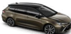
2RF Oxide Bronze/Eclipse Black lakier metalizowany bez dopłaty – Selection Essence