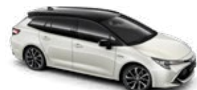
2KR Pearl White/Eclipse Black lakier perłowy bez dopłaty – Selection Pure