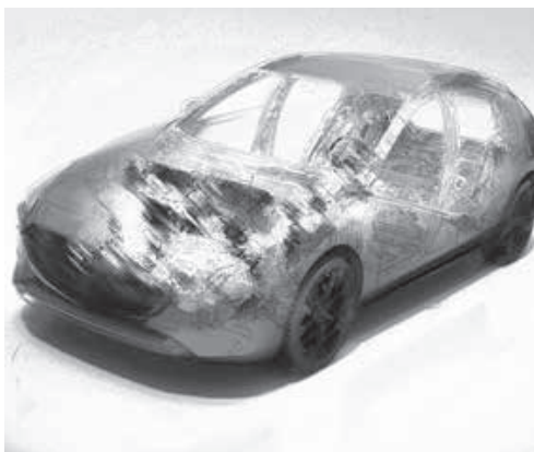
INGENIOUS SOLUTIONS INTELIĞENTNE ROZWIĄZANIA