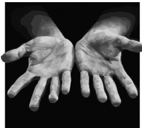
JAPANESE MASTERY JAPOŃSKI KUNSZT