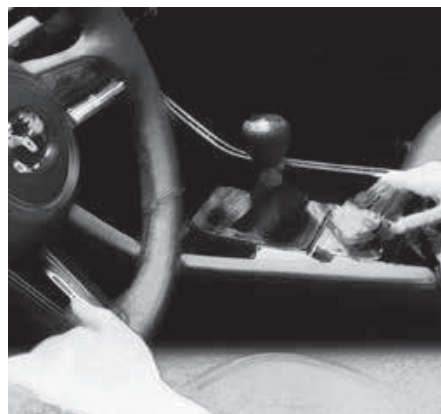
EFFORTLESS JOYFUL DRIVING CZYSTA PRZYJEMNOŚĆ PROWADZENIA