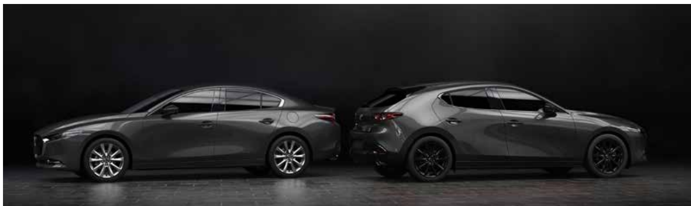
MACHINE GRAY (46G)*