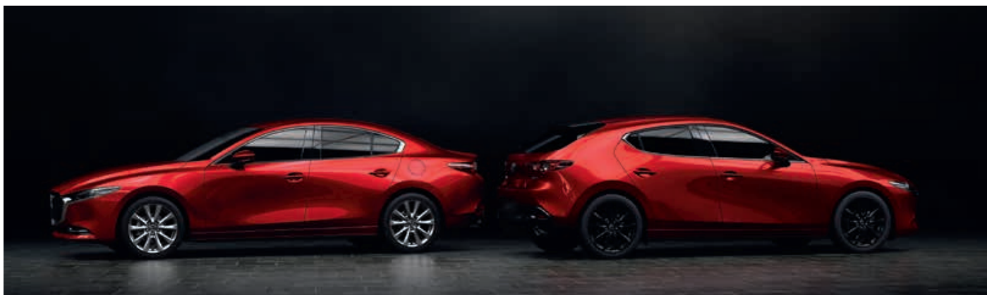
SOUL RED CRYSTAL (46V)*