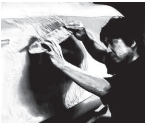
ARTFUL DESIGN SZTUKA DESIGNU