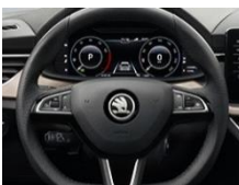
Skórzana podgrzewana kierownica wielofunkcyjna (radio, telefon) z pakietem skórzany