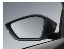
Elektrycznie sterowane, podgrzewane, składane, automatycznie ściemniające się lusterka boczne