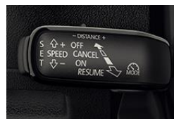
ADAPTIVE CRUISE CONTROL - aktywny tempomat do 210 km/h