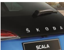
Pakiet Image - przedłużona szyba pokrywy bagażnika, czarne lakierowane lusterka