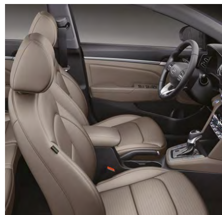
Beżowe – Light Taupe Beige

*Powyższe informację nie określają wszystkich warunków gwarancji. W przypadku, gdy zakup samochodu nastąpił w celu prowadzenia jednej z następujących działalności gospodarczych: taksówka, wypożyczalnia, płatny przewóz osób, gwarancja mechaniczna wynosi 3 lata (36 miesięcy) z limitem 100 000 kilometrów w zależności, co wystąpi wcześniej, podobne ograniczenia dotyczą innych elementów gwarancji.