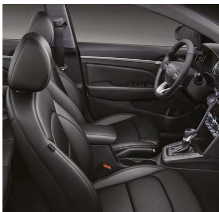
Czarne – Oceanids Black