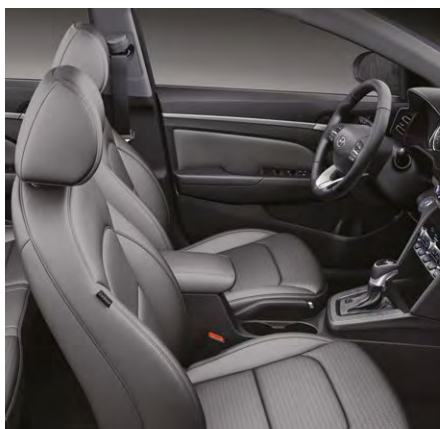
Ciemnoszare – Dark Gull Gray