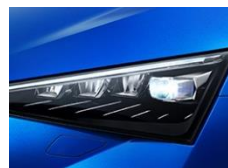
Reflektory przednie FULL LED z funkcją adaptacji świateł AFS