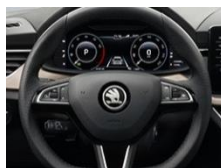
Skórzana podgrzewana kierownica wielofunkcyjna (radio, telefon) z pakietem skórzanym