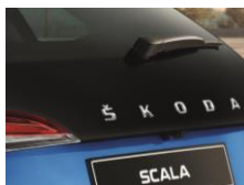
Pakiet Image - przedłużona szyba pokrywy bagażnika