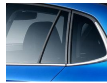
SUNSET - tylne szyby boczne i szyba pokrywy bagażnika o wyższym stopniu przyciemnienia