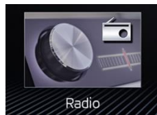
Radio BOLERO (8", dwa gniazda USB-C)