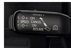
ADAPTIVE CRUISE CONTROL - aktywny tempomat do 210 km/h