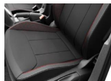
Podgrzewane przednie fotele, podgrzewane dysze spryskiwaczy szyby przedniej