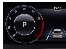
VIRTUAL COCKPIT - Cyfrowy zestaw wskaźników