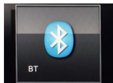
Bluetooth Plus - połączenie z anteną zewnętrzną, bezprzewodowa ładowarka do smartfona