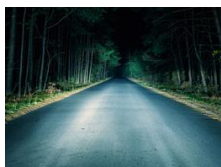
LIGHT AND RAIN ASSIST - czujnik zmierzchu i deszczu, automatycznie ściemniające się lusterko wsteczne