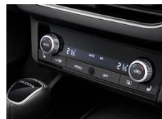
CLIMATRONIC - dwustrefowa klimatyzacja automatyczna z przyciemnianym lusterkiem wstecznym