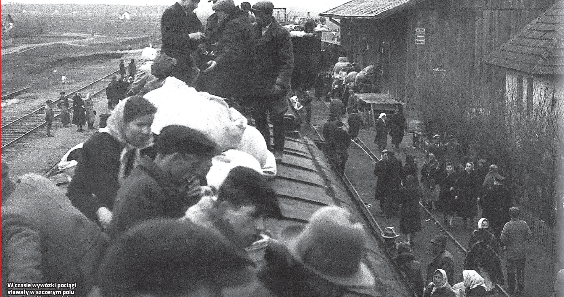
W czasie wywózki pociąg stawały w szczyrim polu nawet na kilka tygodni