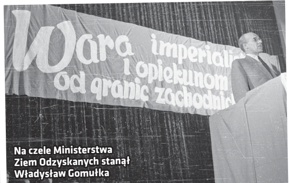
Na czele Ministerstwa Ziem Odzyskanych stanął Władysław Gomułka