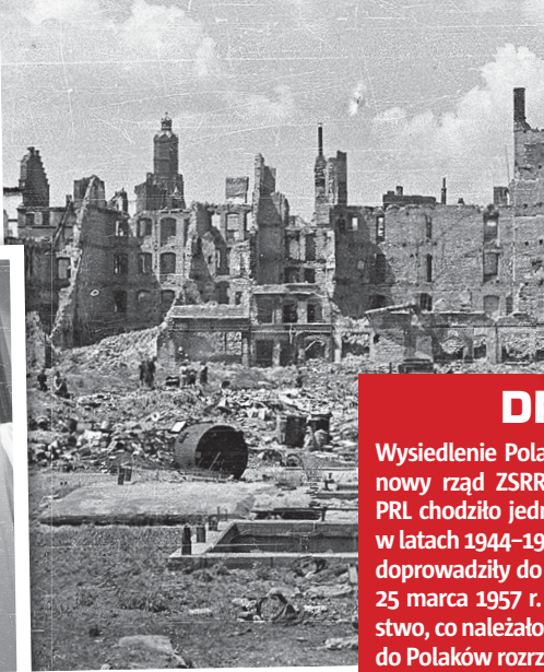
Wrocław, 1946 r. Przybyłych do stolicy Dolnego Śląska witały gruzy

Ministerstwo utworzono 13 listopada 1945 r. Jego zadaniem było prowadzenie akcji osiedleńczej na tych terenach, przyspieszenie procesów integracyjnych z resztą kraju i zarządzanie mieniem poniemieckim. Organ zajął się również wysiedlaniem ok. 3 mln Niemców na zachód. Na czele resortu stanął Władysław Gomułka. Wkrótce z Ziem Odzyskanych utworzono nowe województwa. W 1945 r. powstała gdańskie, a rok później olsztyńskie, szczecińskie i wrocławskie. Po ponad trzech latach działalności – 11 stycznia 1949 r. – ministerstwo zostało zlikwidowane.