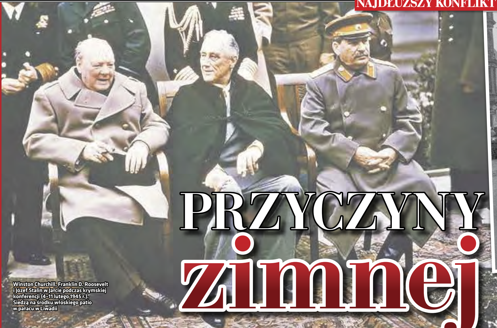
Winston Churchill, Franklin D. Roosevelt i Józef Stalin w Jałcie podczas krymskiej konferencji (4-11 lutego 1945 r.). Siedzą na środku włoskiego patio w pałacu w Liwadii