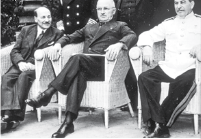
Clement Attlee (Wlk. Bryt.), Harry Truman (USA) i Józef Stalin (ZSRR) – pamiątkowe zdjęcie na zakończenie konferencji w Poczdamie, 2 sierpnia 1945 r.

ność kraju przeciwnika, np. przez dezinformację. Ale do bezpośredniego starcia nie dochodziło, chociaż planowano je mniej lub bardziej skrycie. Uznawano, że do wojny i tak dojść musi, ale w okolicznościach najbardziej niedogodnych dla przeciwnika, a najbardziej korzystnych dla państwa szykującego agresję. W przeciwieństwie do wojny, która zawsze zaczyna się wybuchem, a kończy rozejmem bądź pokojem, zimna wojna na ogół nie ma jednoznacznych dat. Dotyczy to również zimnej wojny toczącej się między Wschodem a Zachodem w latach 1947–1991. FF