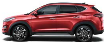
FIERY RED (PR2 - METALICZNY)