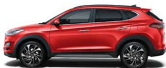
ENGINE RED (JHR - BEZ DOPLĄTY)