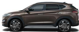
MOON ROCK (2) (XN3 - METALICZNY)