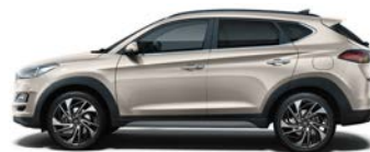
WHITE SAND (1) (Y3Y - METALICZNY)