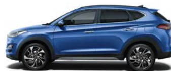
CHAMPION BLUE (1) (2) (U2U - METALICZNY)