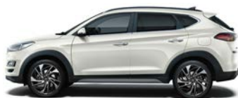
POLAR WHITE (PYW - BEZ DOPLĄTY)