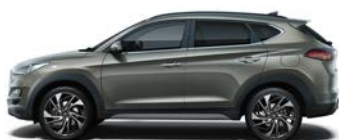
OLIVINE GREY (X5R - METALICZNY)