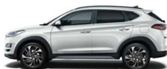
PLATINUM SILVER (U3S - METALICZNY)