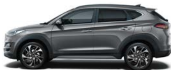
MICRON GREY (Z3G - METALICZNY)