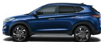
STELLAR BLUE (1) (RWB - METALICZNY)