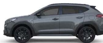
SHADOW GREY (3) (TKG - SPECJALNY)

(1) Kolory RWB, U2U oraz Y3Y niedostępne w wersji N Line (2) Sprawdź dostępność u dealera (3) Kolor TKG dostępny tylko w wersji N-Line