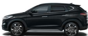
PHANTOM BLACK (PAE - PERŁOWY)